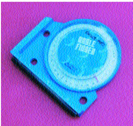
Un simple goniómetro puede sernos muy útil para calcular los ángulos a los que nos enfrentamos. Un trozo de tubo de flecha unido a él nos puede ayudar en el cálculo de la horizontal.

Un tiro vertical hacia arriba sería muy similar. La diferencia es que la gravedad actuaría frenando la flecha a 32 pies/seg cada segundo del vuelo de la flecha. Se tirarían todas las distancias con la misma marca del visor. Pero, ¿Qué ocurre con un tiro real?. El punto clave es que cuando se tira colina arriba o abajo, se está en una situación en la que la gravedad produce un menor desvío de la flecha que en la pura horizontal, con lo que debería ejecutar ambos tiros como si la diana estuviera más cerca. Podemos hacer un análisis más exacto, teniendo en cuenta que las flechas que se tiran a dianas pendiente abajo están menos tiempo en el aire que las tiradas cuesta arriba, ya que van más rápidas, pero ese nivel de detalle es casi innecesario. Lo que necesitamos es un método práctico para estimar con qué intensidad y en qué sentido actúa la gravedad con respecto al vuelo de la flecha en cada caso. Hay una función matemática, la llamada función “coseno”, que calcula esto. Todo lo que tenemos que hacer es multiplicar la distancia (o marca del visor) por el