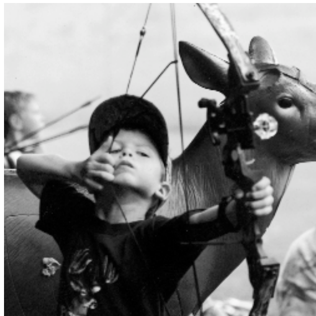
Hacer un tiro divertido y una ejecución con acierto son las claves fundamentales para que los niños no abandonen el tiro con arco

Mucho éxito para Ud. en sus enseñanzas y esfuerzos como entrenador. ☺